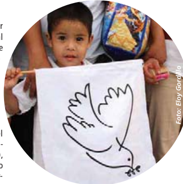
Todos los sectores exigieron paz, incluso los niños

"Los narcotraficantes cambiaron su esquema de ajustes de cuentas; ahora, aplican la extorsión y cobran derecho de piso como fuente de financiamiento. A