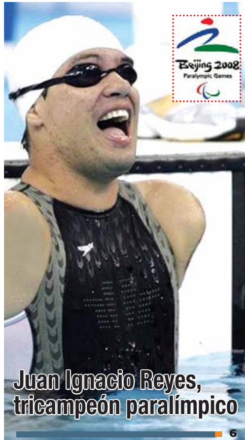
Juan Ignacio Reyes, tricampeón paralímpico