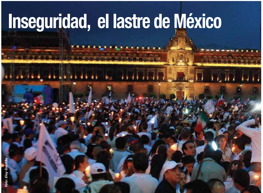
Las calles de la Ciudad de México se vieron abarrotadas de miles y miles de personas que exigieron seguridad para sus familias