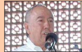
Lic. Víctor García Lizama Presidente Nacional

Así, estaríamos en mejor posibilidad de construir un país mejor, lo mismo que de lograr la buena ley superior a todo hombre, al igual que el Estado de Derecho, la democracia y sus insoslayables presupuestos de justicia social y bien común.