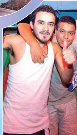
En Constitución de 1917 trabajan apegados al programa de 12 pasos de AA