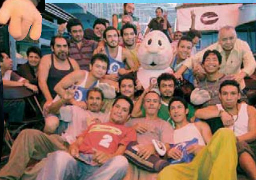
El Centro Constitución de 1917 brinda apoyo a 80 jóvenes y adultos de entre 15 y 50 años con problemas de alcoholismo y drogadicción