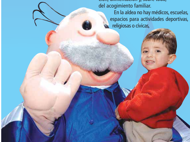
El Dr. Simi compartió alegría y felicidad con los niños de las aldeas infantiles SOS

De 1949 a la fecha, más de seis mil mujeres viven la experiencia de ser madres SOS en estos programas de recogimiento familiar.