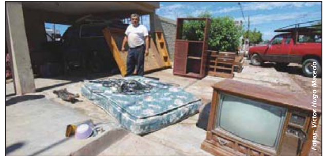
La ayuda del Dr. Simi fue de las primeras en Sonora, para beneficio de mil 500 familias damnificadas

gratuita el medicamento que requieren los enfermos.