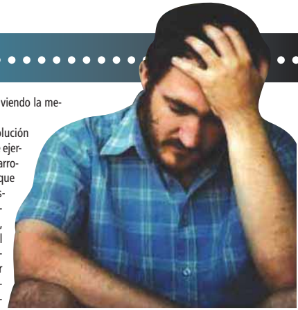
La eyacuación precoz debe atenderse por un médico especialista

coopera en los ejercicios y va viendo la mejoría y evolución. Los tratamientos para su solución son generalmente una serie de ejercicios y técnicas naturales desarrolladas por profesionales que logran identificar aquellos músculos encargados de la eyacuación y trabajar sobre éstos, para así, poder tener un control voluntario sobre dichos músculos y en consecuencia lograr eyacular en el momento indicado. También se puede amirorar la angustia con medicamentos específicos o con algunos antidepressivos que como efecto colateral retardan en algunos pacientes la eyacuación, todo esto bajo la supervisión del médico especialista en sexualidad. No hay medicamentos que "curen" dicha disfunción, hay algunos medicamentos que ayudan a bajar la ansiedad en los pacientes y como consecuencia retarda más la eyacuación sin