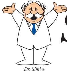
Dr. Simi ©