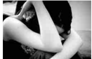
Los cálculos biliares deben de ser atendidos por un médico especialista