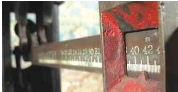
En México las carencias nutricionales afectan sobre todo a la niñez