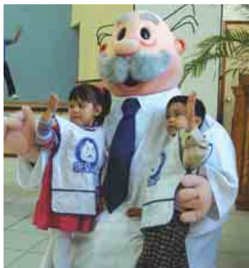
La Fundación del Dr. Simi apoya con donativo

"Más de 100 jóvenes viven en nuestras instalaciones de México sin costo; además impartimos clases de inglés, chino, coreano, danza, música, canto y valores, entre otras actividades", expresa Hyun