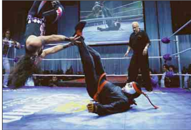
Octagón trabajó en Pemex, estudió leyes y ahora se desarrolla en un cuadrilátero

quería caer en la prepotencia y la indiferencia, cuando nosotros nos debemos al público y ellos se merecen respeto".