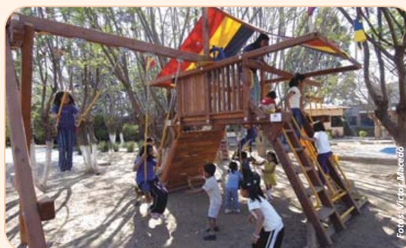
Gracias a la sociedad oaxaqueña y al Dr. Simi es como se mantiene el Albergue Josefino

Mayores informes 54.22.01.15 o desde el interior de la república, sin costo, al 01.800.911.66.66.