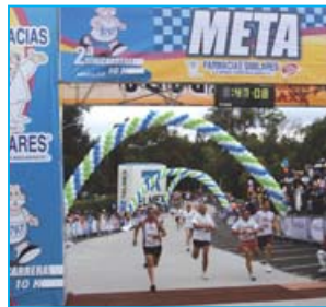
Todo está listo para el próximo 24 de mayo

Farmacias Similares en coordinación con las autoridades Municipales y el aval de la Asociación de Atletismo del Estado de Puebla se complacen en invitarle a participar en esta fiesta deportiva.