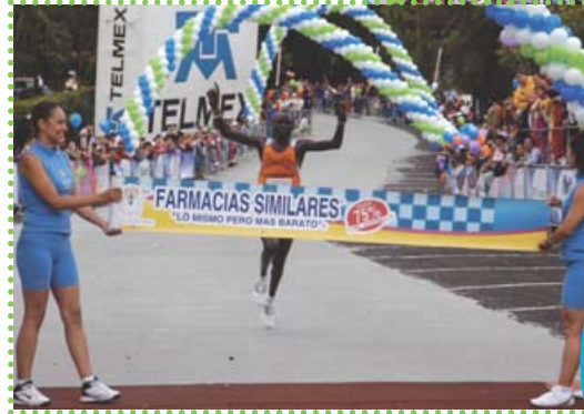
Para la Segunda Gran Simicarrera 10k Puebla 2009 se han confirmado más de mil 500 corredores en cinco categorías

Los ganadores absolutos, en ambas ramas,