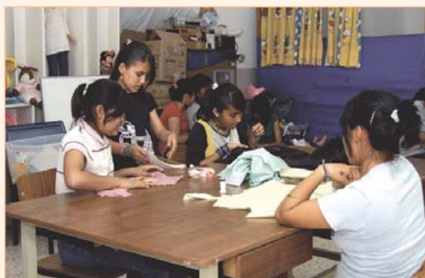
El Albergue Infantil Josefino de Oaxaca, es una opción para el desarrollo de la niñez