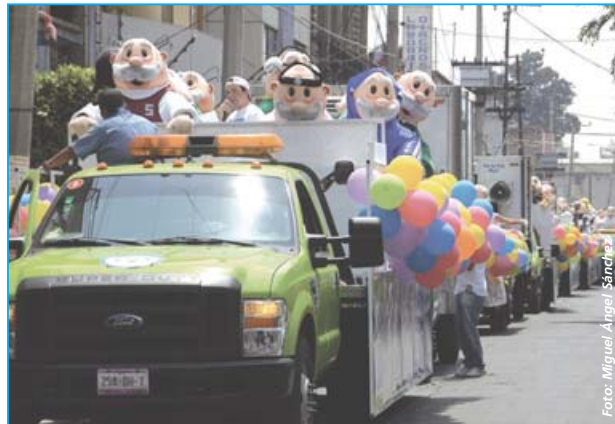
El Dr. Simi salió en caravana por las calles de la Ciudad de México para alegrar a los transeúntes

El carismático y siempre bien vestido Dr. Simi volvió a arrancar suspiros; provocar mucha alegría y demostrar que ser feliz, sí se puede. Él, personalmente, saludó a todos sus amigos y tal como lo adelantó para Siminforma , tras esta exitosa incursión en el Distrito Federal, lo más seguro es que pronto viaje a otras entidades para encabezar caravanas de alegría que nos permitan alejarnos un poco de las preocupaciones cotidianas.