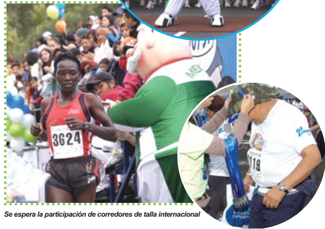
Se espera la participación de corredores de talla internacional

Mayores informes en: www.farmaciasdesimilares.com.mx o en www.emociondeportiva.com.mx