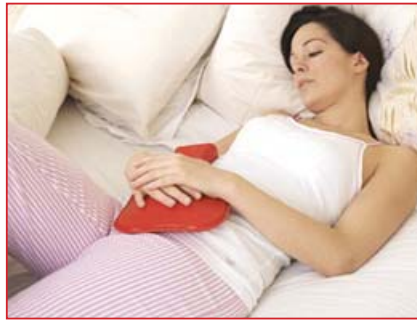
Las mujeres que presentan endometriosis deben llevar una dieta sana y practicar ejercicio con regularidad

Medicina preventiva y recomendaciones generales: Vivir con el dolor pélvico crónico puede ser difícil, por lo que se recomienda realizar ejercicio, ya que usualmente ayuda a mejorar o disminuir el dolor y los cólicos menstruales. Comer bien, tener suficiente des-