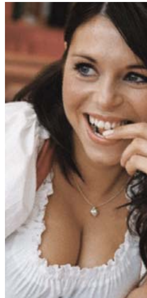
Con el apoyo psicológico aprendes a reconocer también momentos agradables en la vida

Con información de la psicóloga Gabriela Jiménez V.