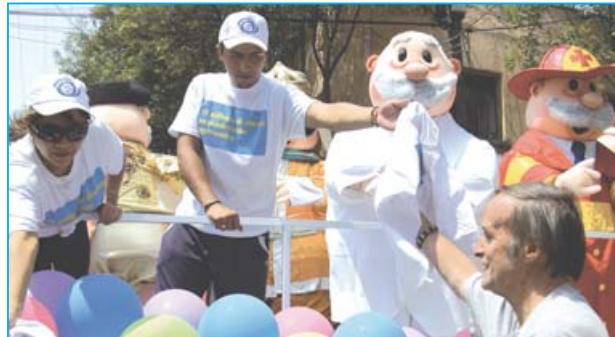
En la caravana se repartieron regalos y obsequios del Dr. Simi