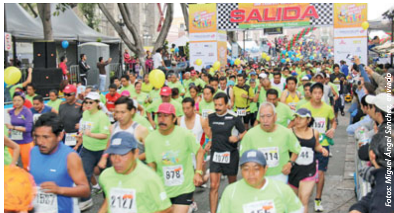
Puebla volvió a vibrar con la Simicarrera 10K 2013 con la participación de más de 4 mil atletas

En su sexto año de organizarse en Puebla, la Simicarrera se ha posicionado como una auténtica prueba de la familia; es de lo más común ver a los competidores empujando la carriola de sus hijos o trotando al lado de su mascota. Como es una tradición en las pruebas del Dr. Simi, tam-