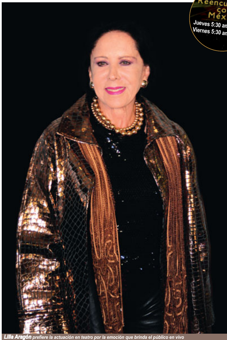
Lilia Aragón prefiere la actuación en teatro por la emoción que brinda el público en vivo