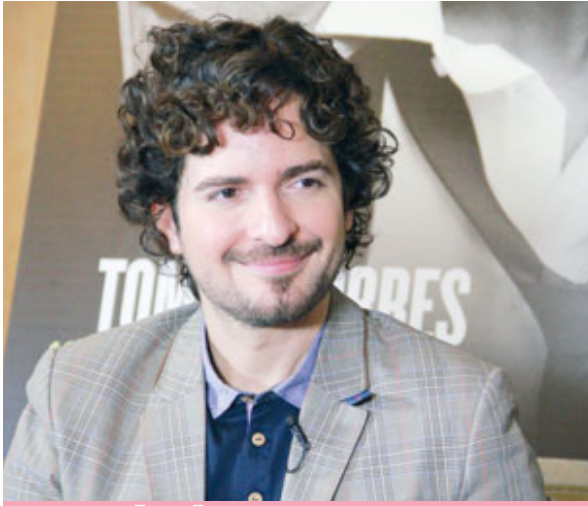
En su nuevo disco Tommy Torres canta al lado de Juanes, Ricky Marti y Alejandro Sanz

Su sencillez lo caracteriza, su estilo musical es inconfundible y su posicionamiento en el gusto del público es constante; se trata de Tommy Torres, quien habló en exclusiva para Siminota Musical , acerca de su nuevo disco, 12 Historias .