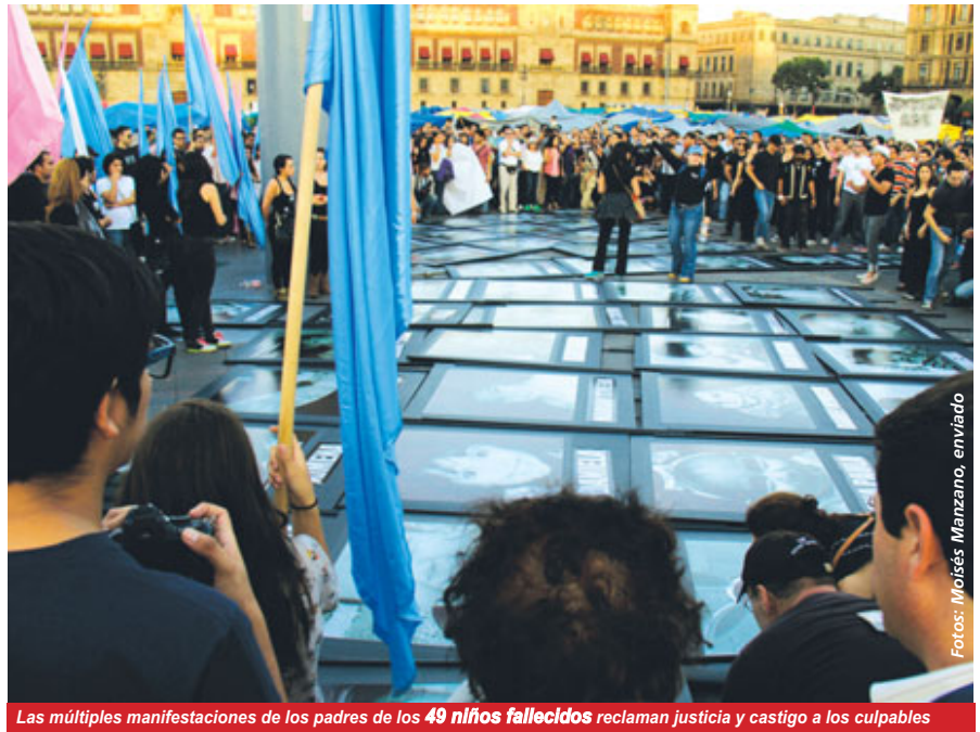
Las múltiples manifestaciones de los padres de los 49 niños fallecidos reclaman justicia y castigo a los culpables

"Hemos avanzado en nuestras demandas, pero la justicia va lenta. Seguimos exigiendo castigo para todos los responsables, y que se acelere la Ley 5 de Junio, la cual servirá para regular a todas las guarderías del país, donde actualmente peligran los niños", expresa