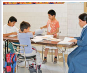
Más de 50 niños huérfanos o abandonados reciben atención en la Fundación Hernández Villar

y una lanza. Su mirada inspira tranquilidad. Seis reclinatorios con igual número de sillas. El espacio es pequeño. Al fondo un vitral que representa la famosa higuera que reverdeció cuando se hizo santo. En la parte de arriba un óleo original que representa el martirio que sufrió. En cada espacio de este refugio se palpa el misticismo, algo indescriptible, que solo quien pone sus pies en ese piso sabrá de lo que hablamos. No deje de visitarla y conocer más a cerca de la reliquia de madera hecha por nuestro primer santo mexicano, además de que podrá salir "santificado" por el apoyo que pueda brindar a la obra que realizan las Hermanas del Sagrado Corazón de Jesús, en beneficio de niños en situación de exclusión social.