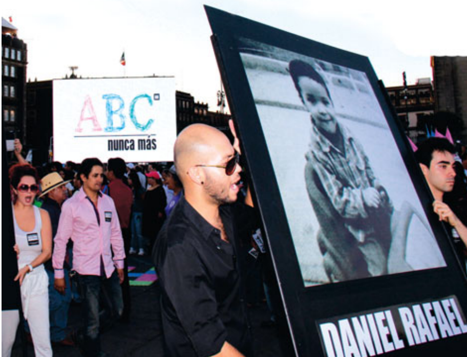
Han pasado más de cuatro años de lucha y dolor de los padres que perdieron a sus hijos a causa del incendio en la guardería ABC, de Hermosillo, Sonora