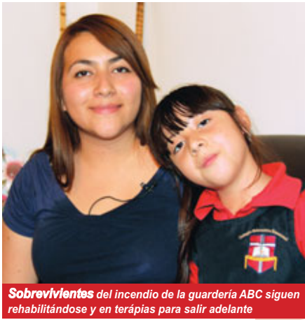
Sobrevivientes del incendio de la guardería ABC siguen rehabilitándose y en terapias para salir adelante