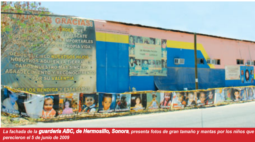
La fachada de la guardería ABC, de Hermosillo, Sonora, presenta fotos de gran tamaño y mantas por los niños que perecieron el 5 de junio de 2009