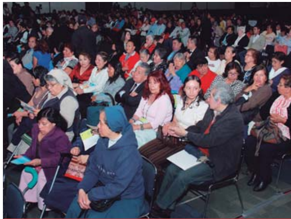
Más de mil 700 personas de todos los sectores, acudieron a la 11.ª Premiación Nacional del Altruismo en el World Trade Center, de la ciudad de México