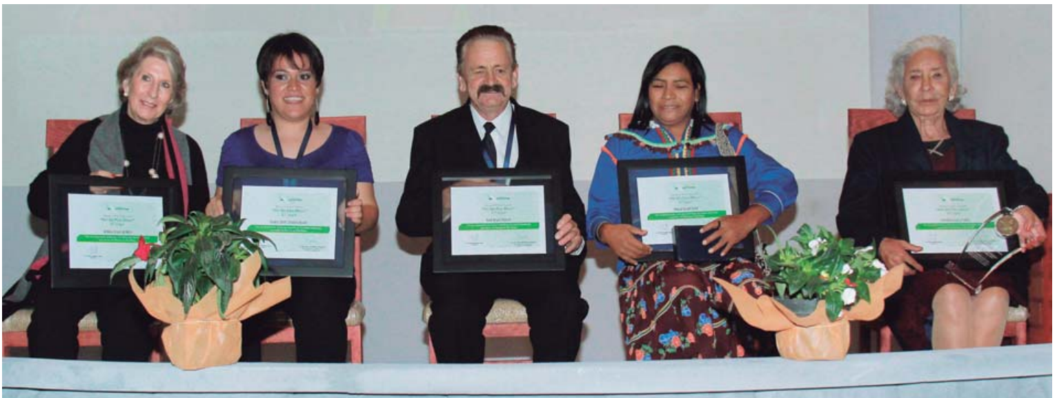
Los orgullosos ganadores de la categoría de Por Un País Mejor, fueron reconocidos por su labor que realizan para apoyar a sectores vulnerables del país

Enhorabuena para todos aquellos interesados en servir a México.