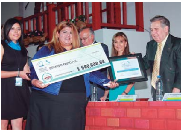
La institución Llevando Futuro AC, de Baja California, fue la ganadora en la categoría Unidos Para Ayudar, con un premio de 500 mil pesos.

Los premios, reconocimientos, aplausos y flashazos no cesaron;