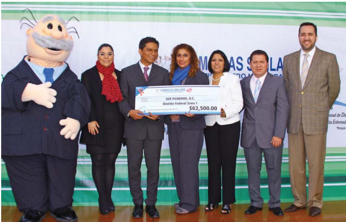
Fundación Ser Humano recibió de manos de Farmacias Similares un donativo de 62 mil 500 pesos para apoyar pacientes infectados con el VIH-sida

Farmacias Similares entregó el segundo donativo correspondiente al 5 % de la venta del Simicondón con sabor y aroma; esta vez, a la asociación civil Ser Humano.