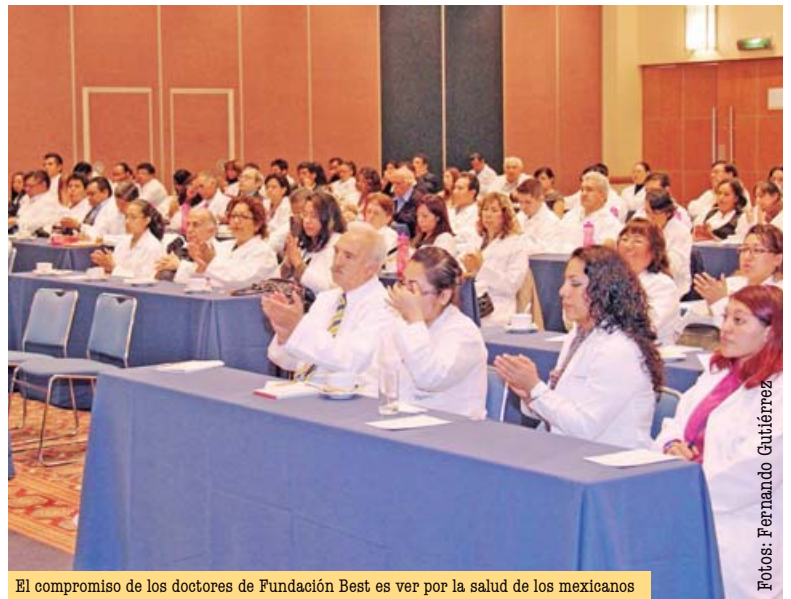
El compromiso de los doctores de Fundación Best es ver por la salud de los mexicanos

Ante cerca de 500 médicos convocados en dos sesiones, Villafaña Peralta expresó: "Otra exigencia son los expedientes