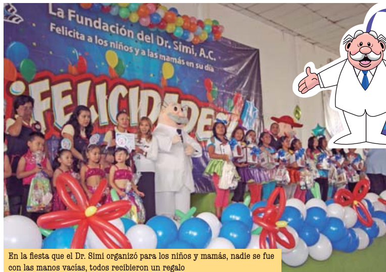
En la fiesta que el Dr. Simi organizó para los niños y mamás, nadie se fue con las manos vacías, todos recibieron un regalo

La Fundación del Dr. Simi no podía pasar por alto dos de las fechas más importantes para la familia mexicana, y festejó a madres y niños en su día