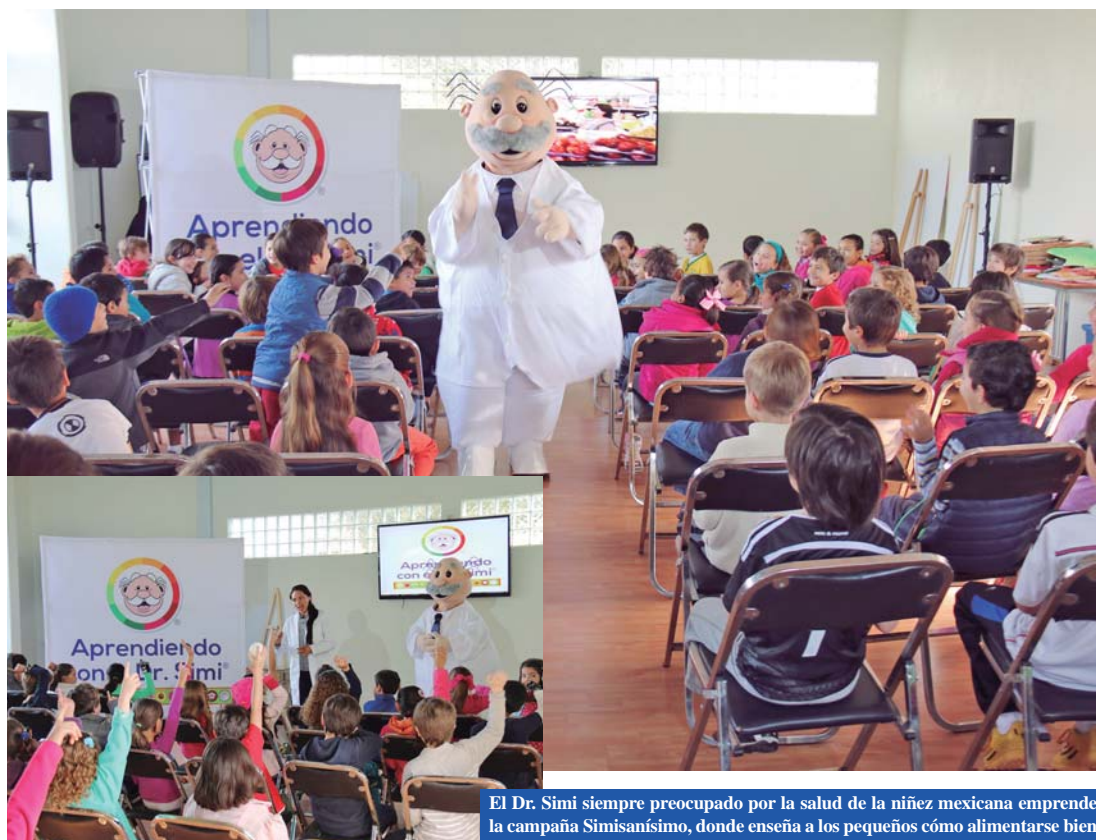
El Dr. Simi siempre preocupado por la salud de la niñez mexicana emprende la campaña Simisanísimo, donde enseña a los pequeños cómo alimentarse bien

Inculcar en la población infantil hábitos alimenticios adecuados reducirá sustancialmente los elevados índices de obesidad en México.