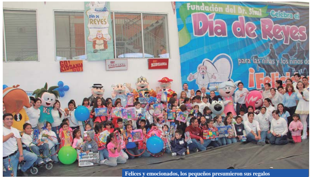
Felices y emocionados, los pequeños presumieron sus regalos

De regreso a casa, los invitados de honor recibieron un kit sorpresa, lleno de más regalos que, gracias al Dr. Simi y KidZania, les hará conservar la ilusión en los Reyes Magos.