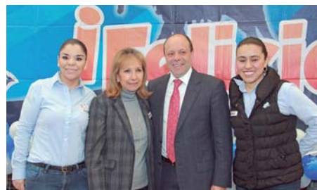
Gracias a la alianza de 2 empresas altruistas se logró hacer felices a muchos niños