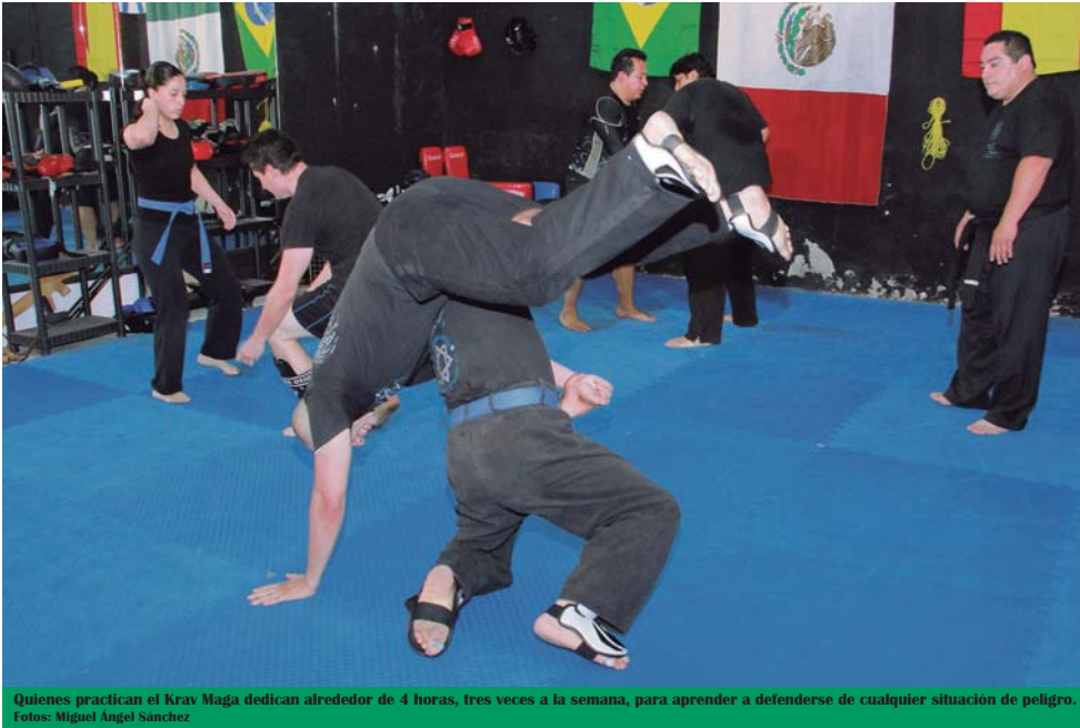
Quienes practican el Krav Maga dedican alrededor de 4 horas, tres veces a la semana, para aprender a defenderse de cualquier situación de peligro.

Ana camina sola e intenta hacer una llamada con su celular. De pronto, alguien la sorprende por la espalda y le pone un cuchillo en el costado izquierdo. Se trata de un asalto. Tras aparentar acceder a entregar su teléfono, con un movimiento felino gira y logra desarmar al delincuente. Lo anula al golpearlo en los oídos y testículos. Finalmente, logra escapar a toda prisa.