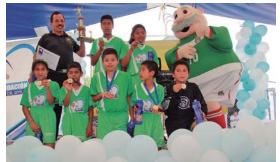
Con los torneos relámpago se fomenta el deporte por una mejor calidad de vida en todo el país

La violencia se ha convertido en un problema social generalizado en México. Sin embargo, hay zonas de nuestro país en las que esta situación se agrava, como ocurre en el municipio de Ecatepec, Estado de México.