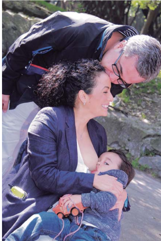
El apoyo y comprensión de la pareja es indispensable para impulsar la lactancia materna.

Cuando una mamá amamanta a su hijo desde el primer día de su nacimiento, este acto de amor le brindará al bebé enormes beneficios a lo largo de su vida. Sin embargo, en la república mexicana esta práctica milenaria corre el peligro de desaparecer.