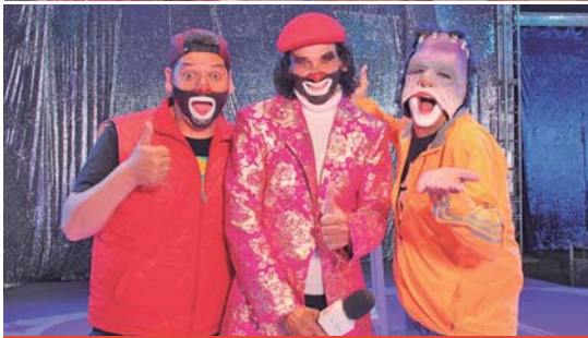
Cepillín, el payasito de la tele, tiene 71 años de edad y continúa divirtiéndose a la gente con su circo, en el que lo acompañan sus hijos Cepi y Franky.

cían: ‘Mucha ropa’, y yo les respondía: ‘Allá, adentro, tengo más...’.