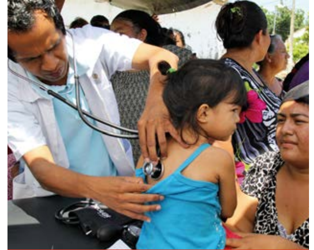
Brigadas médicas ofrecieron consulta y medicamento gratuito