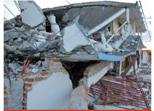
70 por ciento de inmuebles afectados.