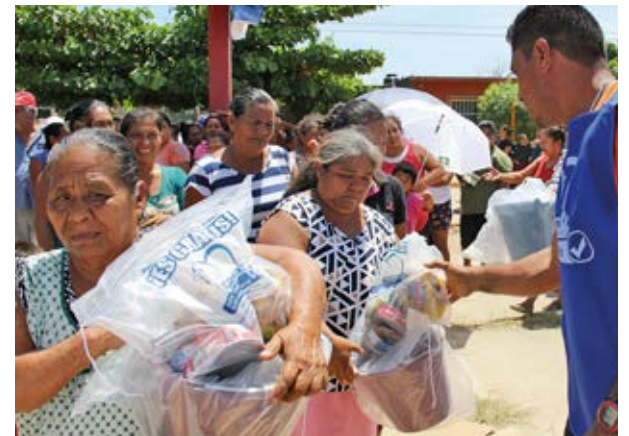
Juchitecos agradecieron los alimentos y el agua potable.