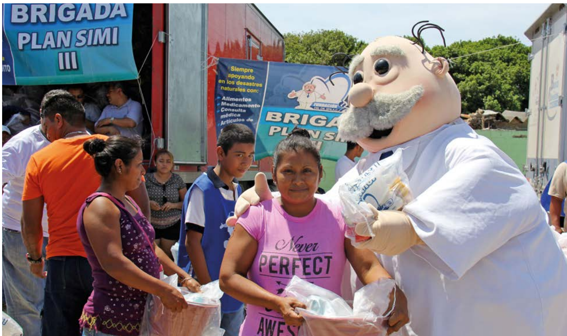
Más de 6 toneladas de alimentos fueron entregados a zapotecos