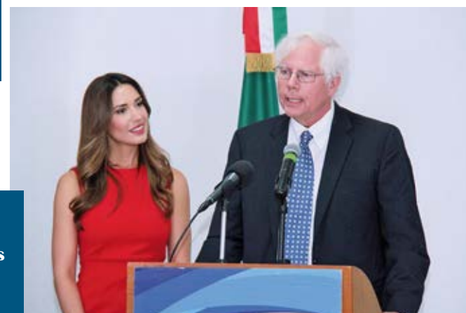
Gracias a los corredores de la XI Simicarrera de la Ciudad de México, indígenas de la comunidad de Chikué iluminarán sus hogares