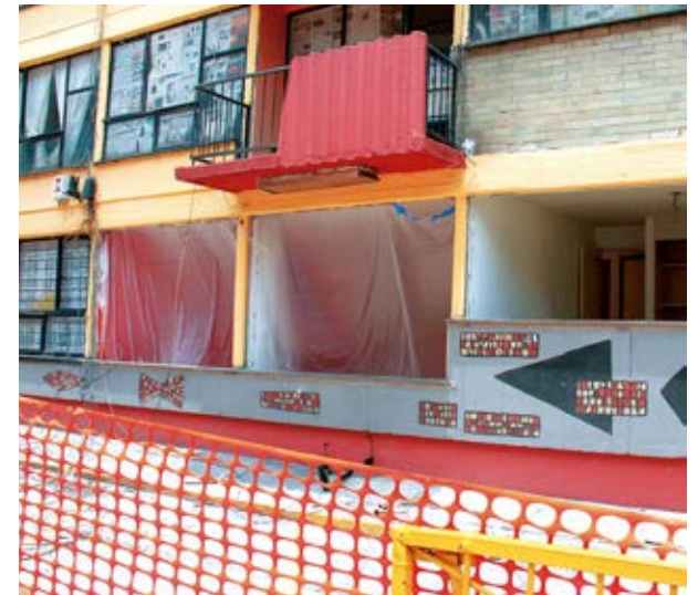
Cerca del 60 % de quienes viven en el Multifamiliar Tlalpan son gente de la tercera edad, y varios de ellos han muerto fuera de su hogar

aledaños a su hogar, donde las secuelas del sismo aún son palpables.