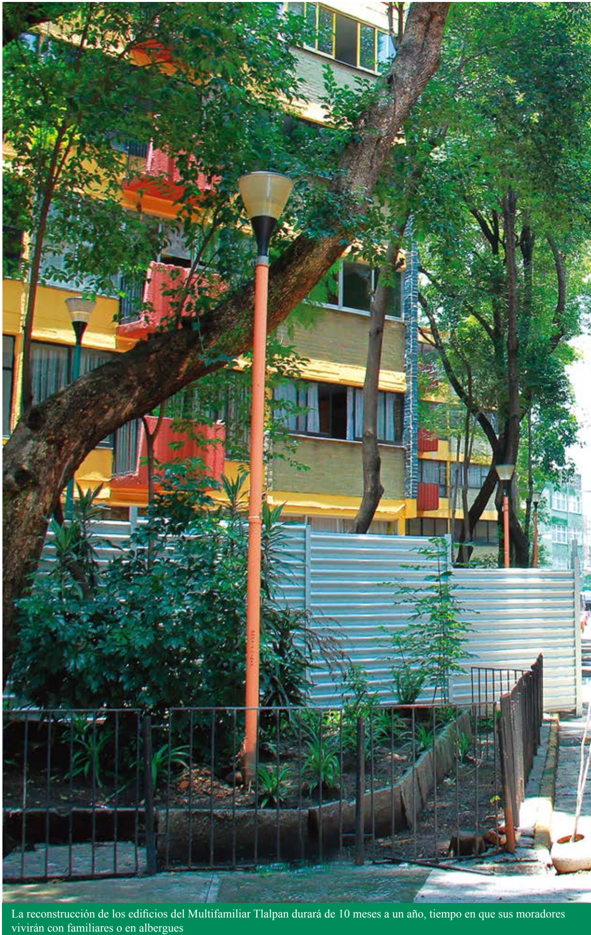
La reconstrucción de los edificios del Multifamiliar Tlalpan durará de 10 meses a un año, tiempo en que sus moradores vivirán con familiares o en albergues