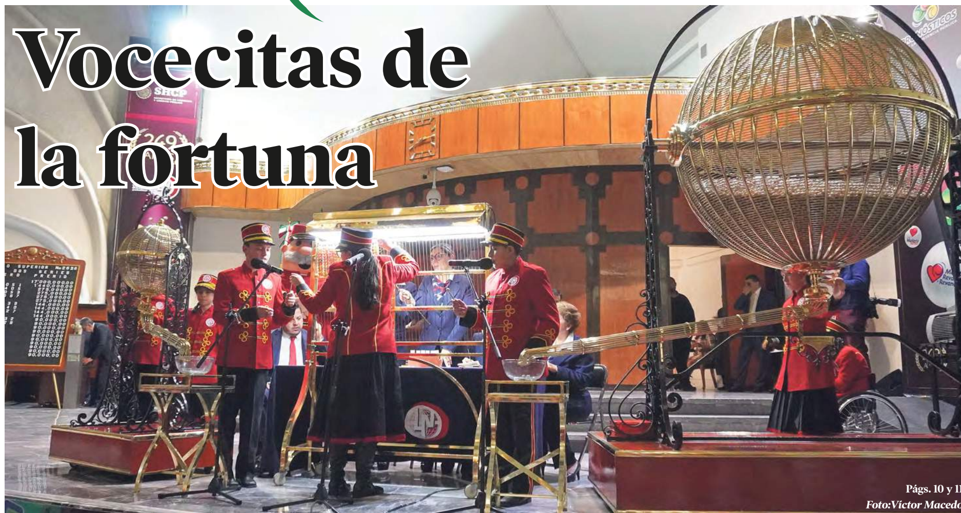
Págs. 10 y 11