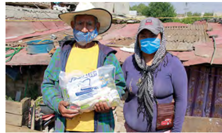
La familia Rivas agradeció el apoyo brindado por la fundación

Estos apoyos se unen a las 35 mil 500 despensas entregadas por Fundación del Dr. Simi a las familias más necesitadas.