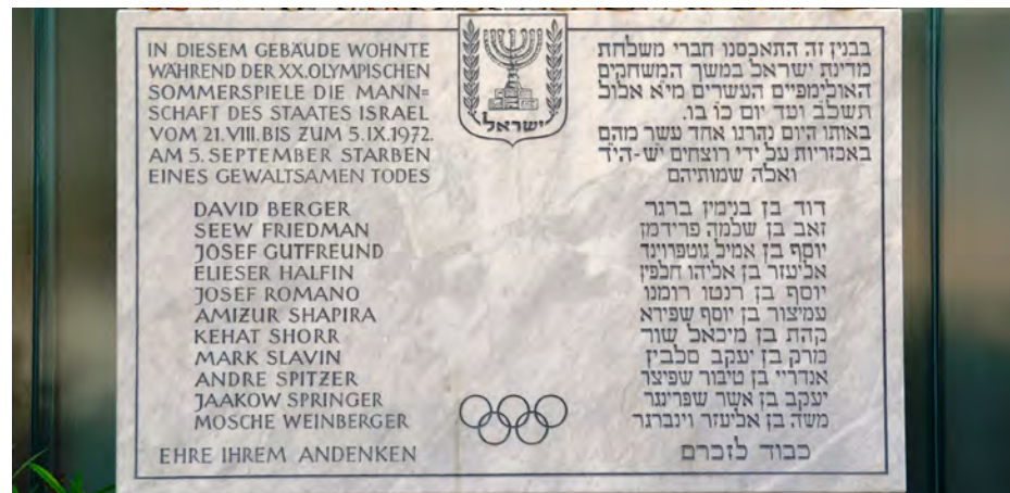
Memorial de las víctimas de la Masacre de Múnich / Foto: wikipedia.org/High Contrast

Fernando Gutiérrez Pérez fgutierrezp@gmail.com