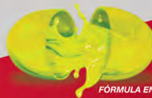
FÓRMULA EN CÁPSULA BLANDA