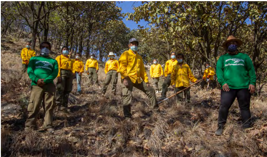
La brigada de reforestación brindó empleo a los habitantes del ejido Mesón de Copala, en el municipio de Zapopan, Jalisco