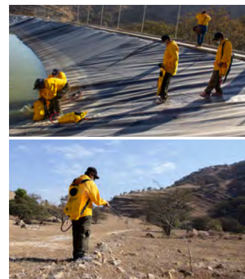
El riego y las acciones de mantenimiento son esenciales para garantizar la permanencia de los 24 mil árboles reforestados

en 2020, cuando la brigada local de Reforestamos México, sembró 24 mil plantas, entre robles, encinos, vara dulce, mezquites y guamúchiles, especies endémicas de la zona. Tras este trabajo, 30 hectáreas del ejido están en constante observación por los integrantes de este equipo.