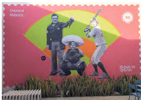
Museo Filatélico de Oaxaca

Cada cierta temporada, son cambiadas algunas de las exposiciones, para darle al visitante la oportunidad de descubrir un poco más de la historia al observar cientos de estampillas. Es un museo único y gratuito, en una casona increíble. Considérelo en su próxima parada por la ciudad de Oaxaca, patrimonio cultural de la humanidad.