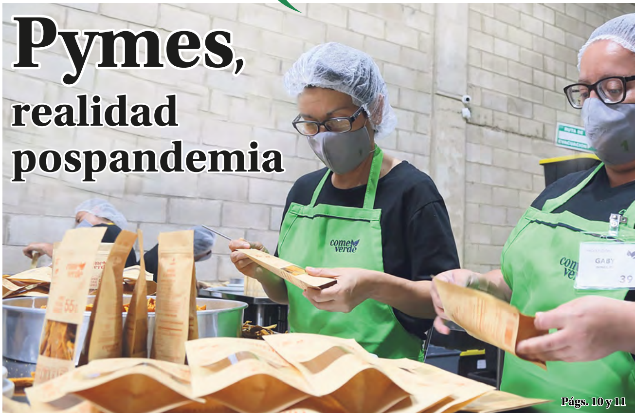
Págs. 10 y 11