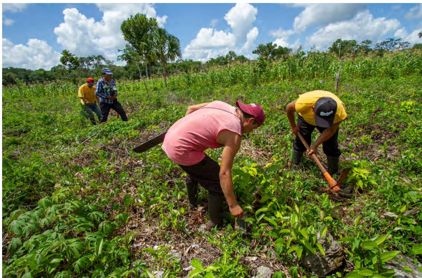
Habitantes de Chan Santa Cruz realizando actividades de reforestación de caoba en el ejido.

En las comunidades mayas de Chan Santa Cruz, Chanchah y Yoactún se reforestan 60 hectáreas con árboles de caoba, tzalam, ciricote, ramón, granadillo y cedro. El propósito es plantar 600 árboles por hectárea. Estas