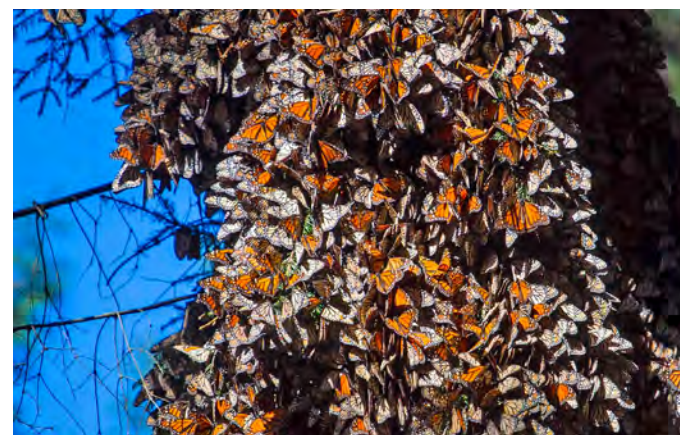
Reserva de biosfera de la mariposa monarca

Lo invitamos a conocer la lista completa de los sitios mexicanos clasificados como patrimonio en la página whc.unesco.org . Y, por qué no, planear alguna visita. Seguro alguno de estos lugares está cerca de usted. /SíMiPlaneta