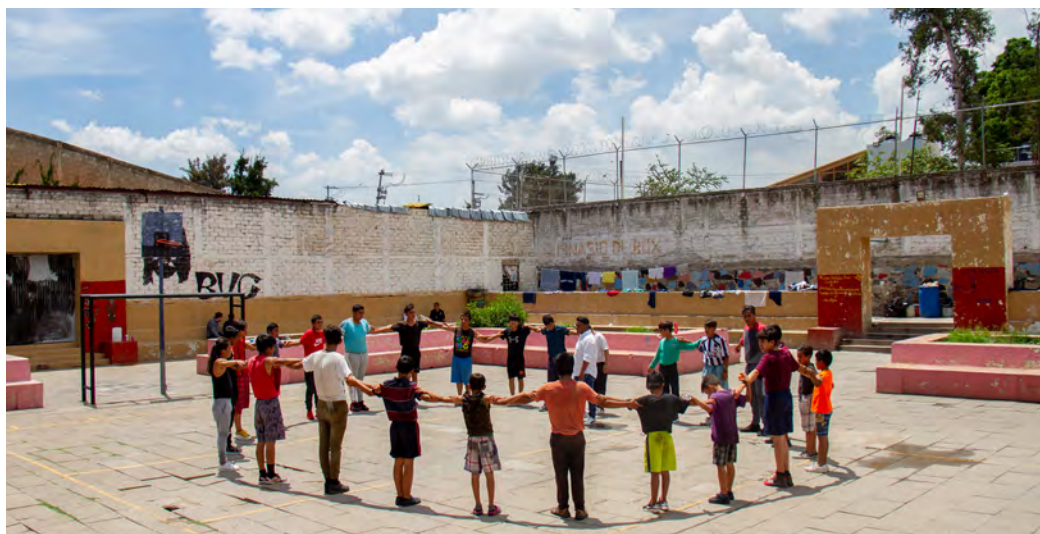
Con atención integral, niños, adolescentes y jóvenes son reinsertados a la sociedad, quedando fuera de vínculos delictivos