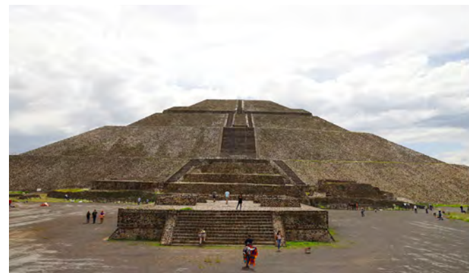
Ciudad prehispánica de Teotihuacán