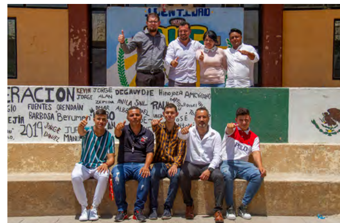
Barrios Unidos en Cristo, asociación civil, nació en 1999 con el objetivo de formar adultos con valores y productivos para el país y el estado.