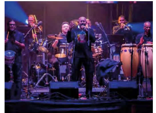
Óscar D'León

Una serie de artistas han confirmado sus conciertos en enero para comenzar 2024 con alegría y diversión. Aquí, la lista de estrellas que nos visitarán.