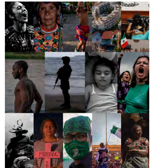
Collage de "Documentar el presente: 14 mujeres en el fotoperiodismo"

El Centro de la Imagen presenta "Documentar el presente: 14 mujeres en el fotoperiodismo", exposición que reúne gráficas de expertas dedicadas al fotoperiodismo y fotografía documental.