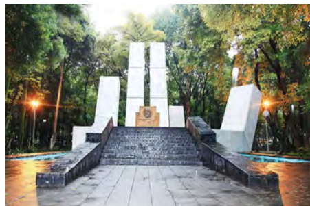
Monumento a Lázaro Cárdenas, parque España