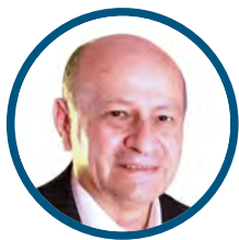
Eduardo Camarena @ecamarena1