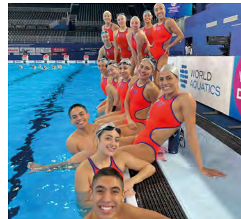
Equipo de natación artística