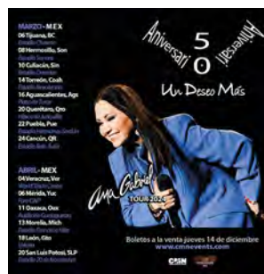
Parte de la gira “Un Deseo más”

Así que esta es la oportunidad para celebrar los éxitos de la cantante en esta gira nacional organizada por Music Vibe, que se caracteriza por presentar sólo a artistas de alto prestigio internacional.