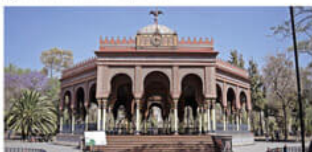
Kiosco Morisco, Santa María la Ribera