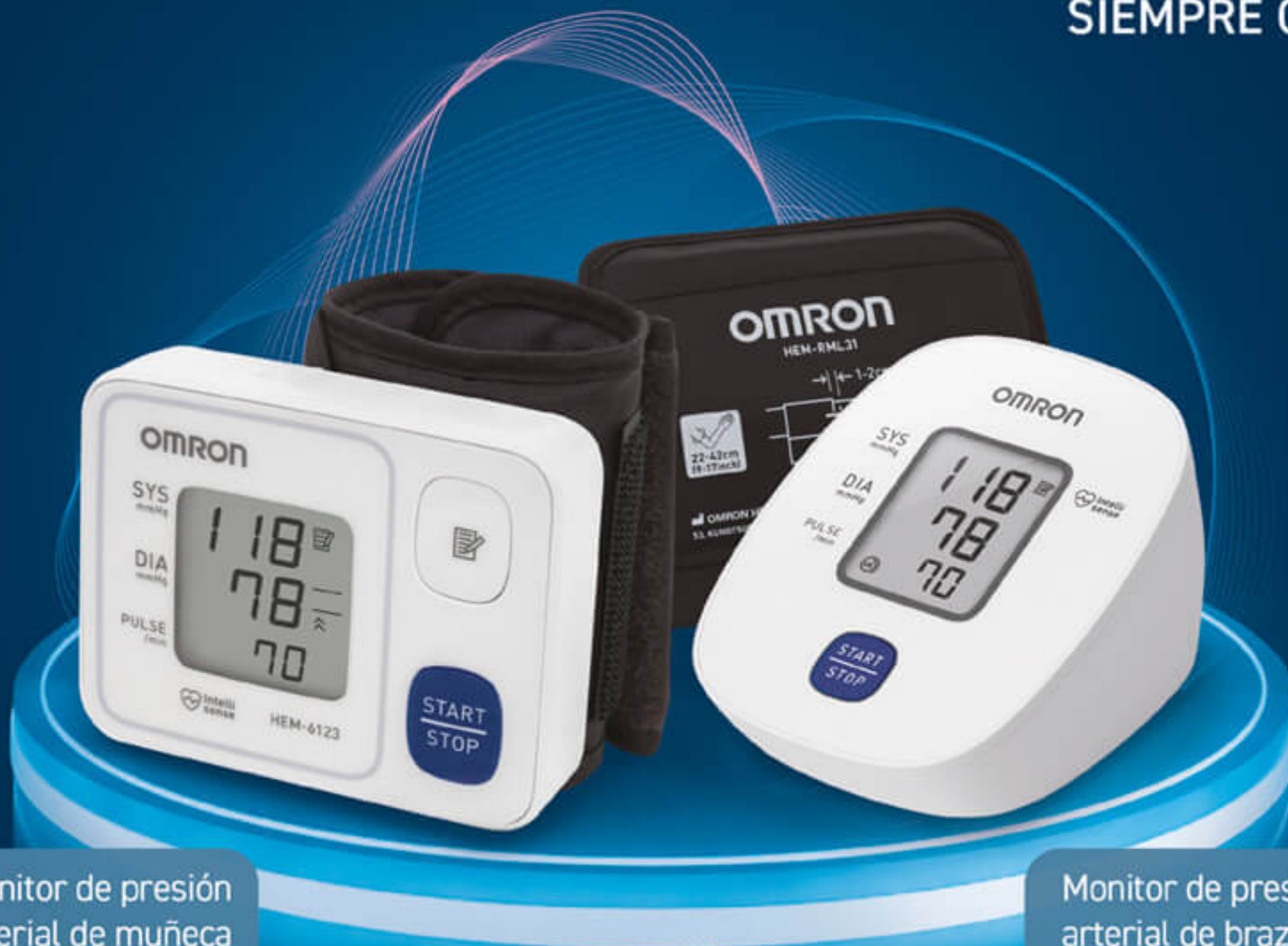
Monitor de presión arterial de muñeca HEM-6123