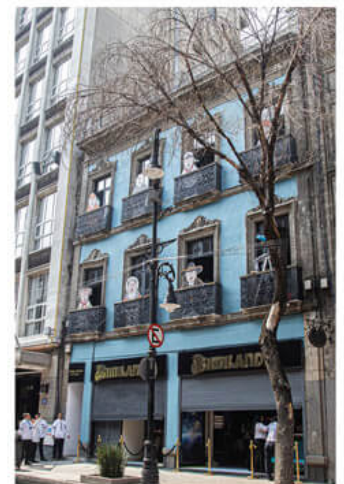
Fachada Similandia Centro