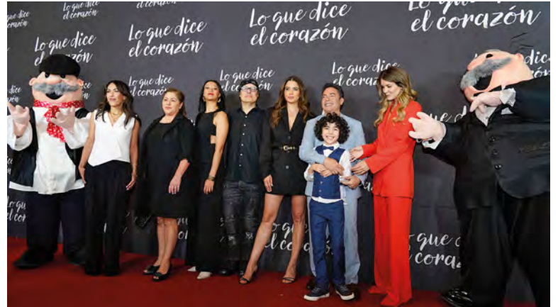
Elenco de Lo que dice el corazón / Fotos: Jessica Osorio