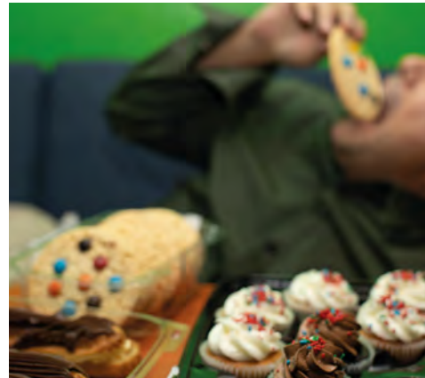
El riesgo de padecer una enfermedad cardiovascular (ECV) aumenta por una alimentación poco saludable