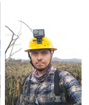
César Ugalde / Fotos: Cortesía

nevado y charrán mínimo que habitan en la laguna de Atotonilco”, comentó.