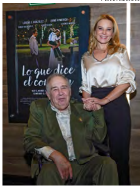
Víctor González Dr. Simi con su pareja emocional, Irma Berlanga