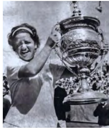
Yolanda Ramírez

Veamos los logros de esta maravillosa mujer: número seis del mundo, dos veces finalista en Roland Garros (1960 y 1961), donde ganó en dobles y dobles mixtos. Además, su gloria se preserva en el Salón de la Fama de Wimbledon y en el de Roland Garros. Y algo más: fue considerada la tenista mexicana del milenio, y campeona nacional en singles en ocho ocasiones.