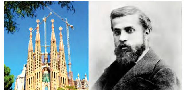
Basílica Sagrada Familia, en Barcelona

Según la Asociación Canónica, Gaudí fue “testimonio de fe, hombre de fe, gran observador de