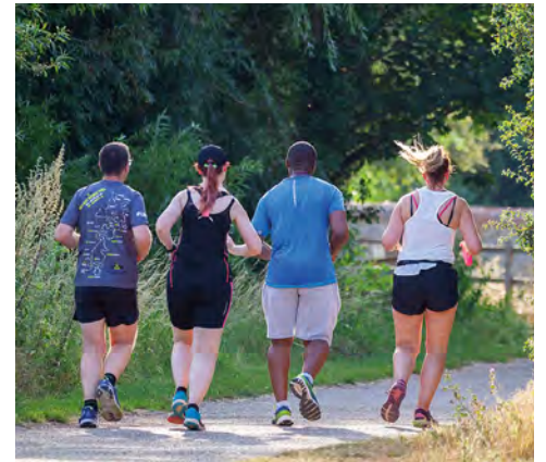
Realizar actividad física con regularidad reduce el riesgo de sufrir enfermedades cardiovasculares

Porque las enfermedades cardiovasculares son una de las principales causas de muerte, pero muchas veces se pueden prevenir si reduces los factores de riesgo y se hacen cambios en el estilo de vida.