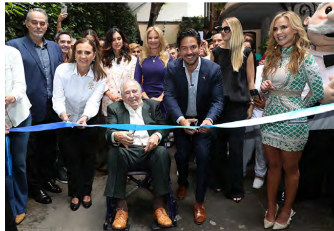
Víctor González Dr. Simi, rodeado de familiares y personalidades