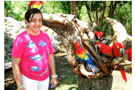
Patricia Escalante Pliego/Foto: Cortesía

Desde 2014, Bosque Antiguo impulsa la reforestación de la Reserva de la Biosfera de Los Tuxtlas, en Veracruz.