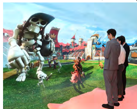
Pantalla inmersiva más grande del mundo