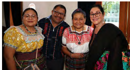
Maya Menchú, Angel Canil, Rigoberta Menchú y Angélica Aragón

más, una sala de cine, una cafetería, un salón de exposiciones, llamado Mundo del Dr. Simi, y un área dedicada a la Fundación SíMiPlaneta, donde, por cierto, se instaló la pantalla interactiva, inmersiva y touch más grande del mundo.