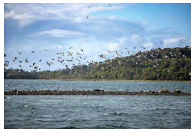
Lobos marinos, delfines australes, gaviotas dominicanas, cormoranes magallánicos y pingüinos, habitan el archipiélago