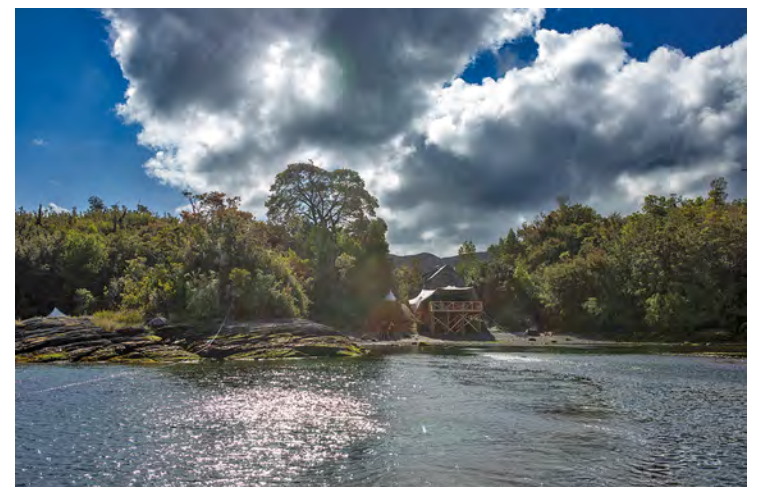
Será el mayor centro de investigación y conservación al sur de Chile