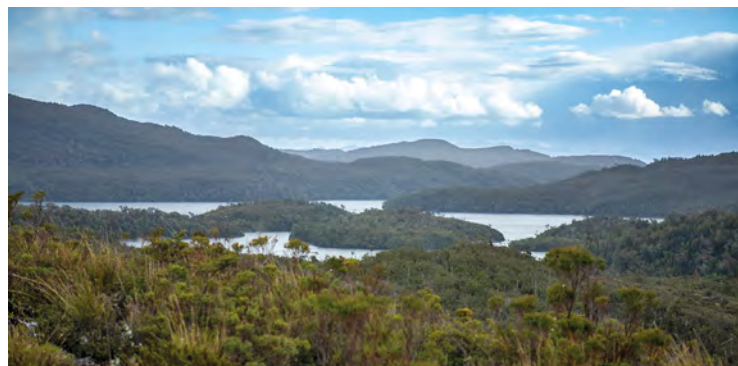
Majestuosos paisajes que ofrecen las mejores vistas de todo el planeta

un equilibrio frágil, silencioso, que parece ajeno al resto del mundo.