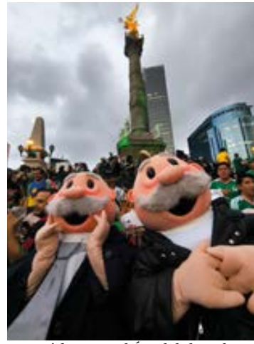
Y sí, hasta en el Ángel de la Independencia los Simiclones pusieron el ambiente

¡Pero, paren todo! Una imponente figura de 6.10 me-