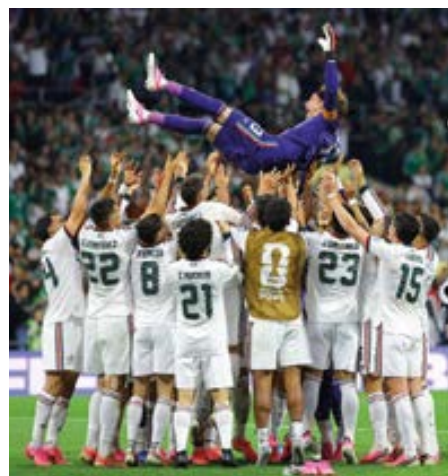
Selección mexicana

Hacía falta, más bien, urgía al país una celebración de millones en todos