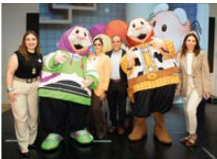
El equipo de Disney estuvo en el lanzamiento de estos Simipeluches