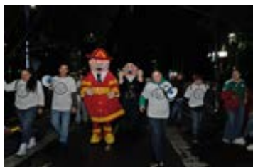
Voluntarios recogiendo residuos

cional, como el Aeropuerto Internacional de la Ciudad de México (AICM) y el embarcadero Nativitas en Xochimilco.