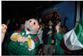
Aeropuerto de la Ciudad de México